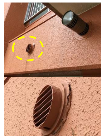
隙間から雨水侵入