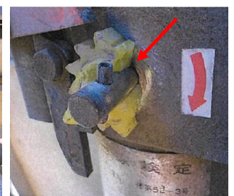
写真3 ワイヤーの破断 写真4 歯車の破損