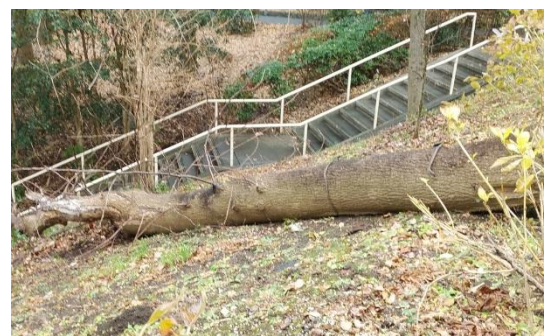
写真5 ユリノキの伐採

1月22日、23日に行った高木剪定の際、台風で傾いていたユリノキを伐採しました。根元が半分以上腐っていて危ない状態でした。（写真5）