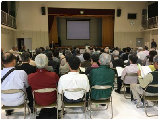
第38回通常総会風景

総会は、横浜わかば学園体育館で開催されました。9時30分から11時50分まで行われ、出席者91名、委任状267名、議決権行使書451名、計809名（組合員総数の91.6%）の住民が議決に参加しました。